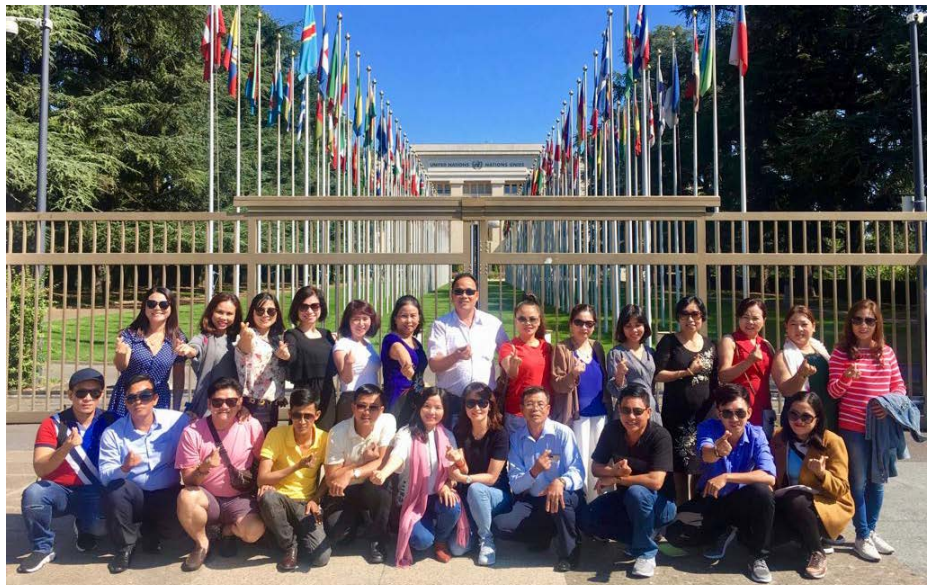
Chuyến đi đã mang đến nhiều trải nghiệm mới lạ và những kỉ niệm đẹp cho các thành viên.