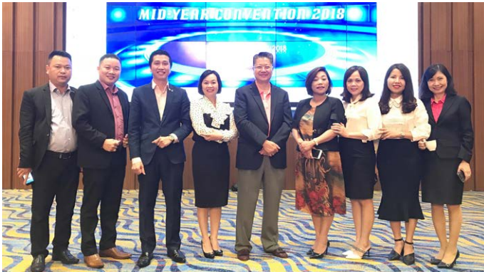
Hội nghị Kinh doanh giữa năm 2018 là cơ hội để các thành viên quản lý cấp cao Chubb Life Việt Nam cùng trao đổi và lắng nghe nguyện vọng của đội ngũ kinh doanh toàn quốc.

Bên cạnh chương trình hội nghị kinh doanh, các thành viên còn có cơ hội tham quan nhiều địa điểm du lịch nổi tiếng và thưởng thức đặc sản của vùng đất Quảng Ninh.