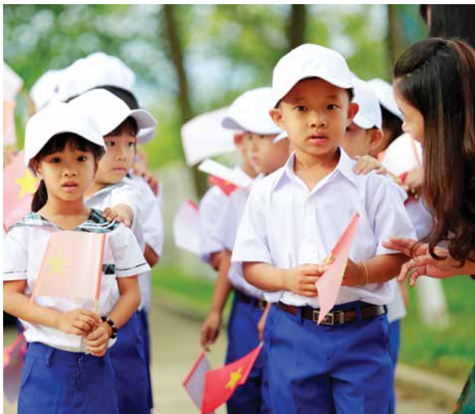
Niềm vui ngày tựu trường...

và thấu hiểu hoàn cảnh thiếu thốn của những ngôi trường trong vùng thiên tai lũ lụt nói chung, và trường Tiểu học Số 2 Vĩnh Thành nói riêng. Không chỉ nhận được sự hỗ trợ về mặt tài chính để xây mới ngôi trường vào năm 2014, năm nay thầy và trò chúng tôi còn vinh dự nhận thêm một món quà đặc biệt từ Chubb Life trước thềm năm học mới 2016 - 2017: máy vi tính, máy chiếu, trang thiết bị thư viện với danh mục các loại sách đa dạng. Chắc chắn những món quà ý nghĩa này sẽ bổ sung đầy đủ hơn cơ sở vật chất của nhà trường, tạo điều kiện dạy và học tốt hơn. Đặc biệt, tủ sách với nhiều đầu sách hay sẽ mang lại cho các em cơ hội tiếp cận những câu chuyện khơi dậy lòng yêu thương con người, tình bạn bè và lòng nhân ái, góp phần tạo cho các em một nền tảng tốt hơn để trở thành những công dân có ích cho gia đình và xã hội trong tương lai”.