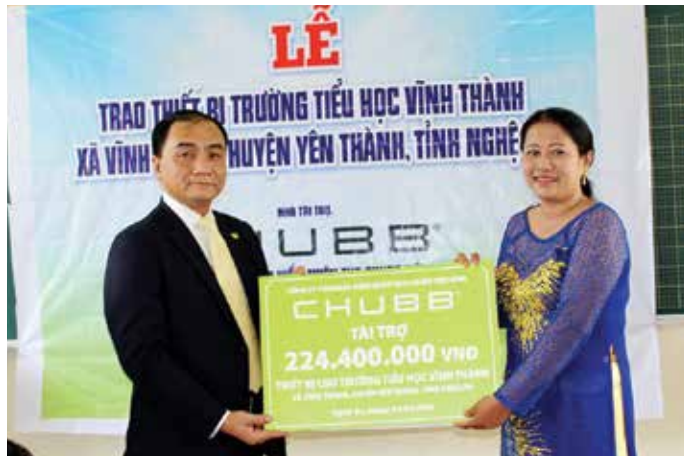
Với sự hỗ trợ tài chính từ Chubb Life, 4 trường tiểu học nói trên có thể khắc phục tình trạng thiếu thốn phương tiện dạy và học, trang bị thêm máy tính, thư viện sách, phòng học tiếng Anh...