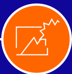
Reemplazo de vidrios