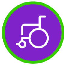
Incapacidad total y permanente