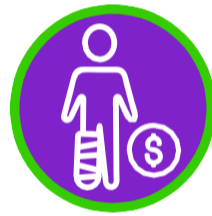
Gastos médicos por accidente