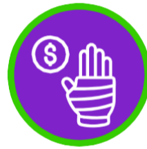
Gastos médicos por quemaduras graves