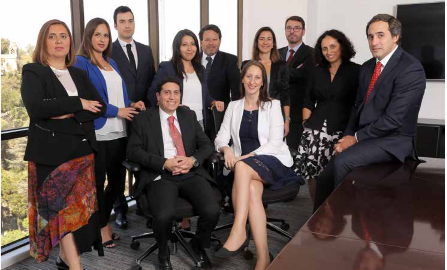
(De Izquierda a Derecha de Pie)