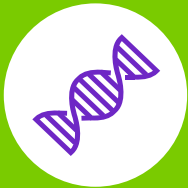
Sciences de la vie

Chubb dispose d'experts à tous les niveaux. Nos Pôles sectoriels couvrent une sélection de secteurs spécialisés en Europe continentale, parmi lesquels :