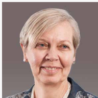
Dame DeAnne Julius (DCMG, CBE) International Economist and Founding Member of the Monetary Policy Committee of the Bank of England